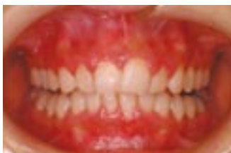
妊娠性歯肉炎(歯周炎) (PIGEON ai report vol.3「妊娠期の口腔ケアと 歯科受診の重要性」：藤岡万里, 2011より引用)